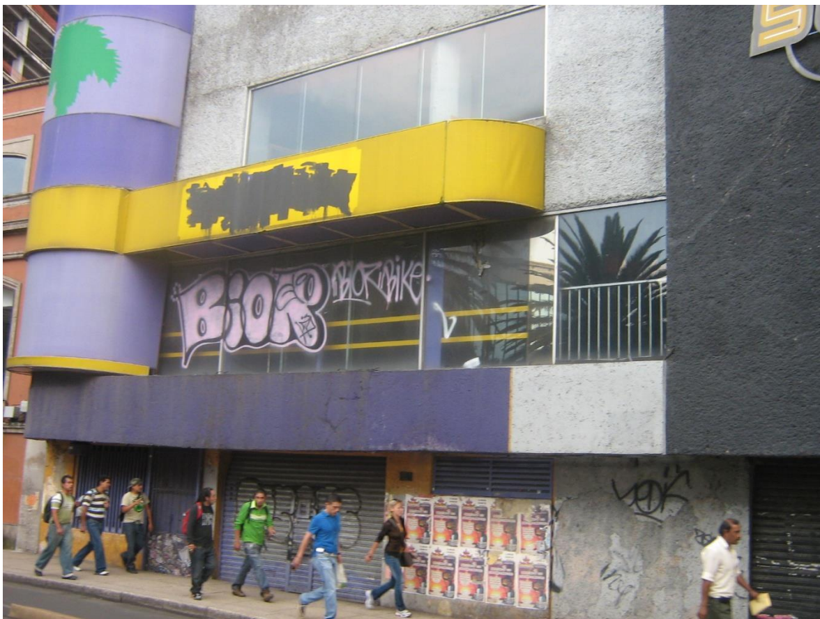
Rock Stock en el 2011, lo que queda es solo el local

costos excesivos, e inclusive, obligaban a los clientes a un consumo mínimo para poder obtener un lugar para sentarse. Rock Stock tomó como ejemplo el concepto de los bares y clubes londinenses y neoyorquinos en donde simplemente había que formarse para entrar y no existían condiciones en el consumo ni reservas para mesas. 24