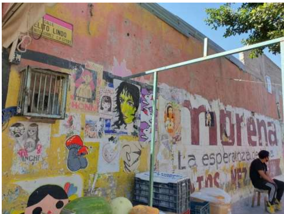
Calle Cielito Lindo en la Colonia Benito Juárez, Nezahualcóyotl con técnica de paste up , intervención artística por grupos de protesta.