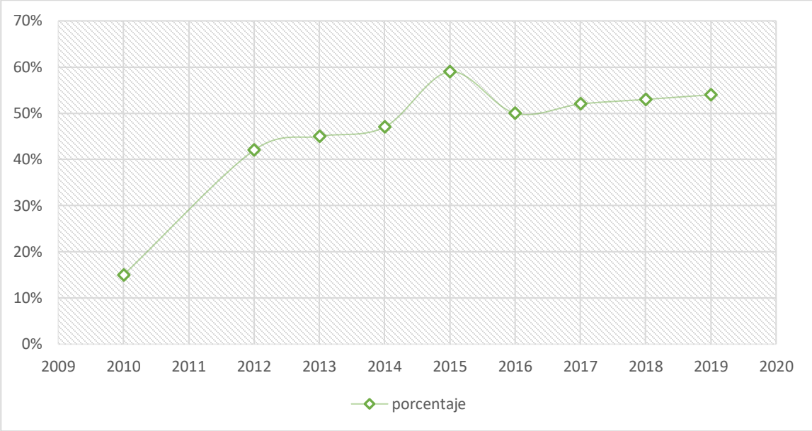
Grafico 1 Aumento de la participación femenina en la educación superior (INEGI 2012-2021)

Es tan grande el avance que hoy en día hay universidades que hasta han implementados protocolos e instancias de atención en tema de violencia de género, también hay algunas que tienen posgrados sobre genero.