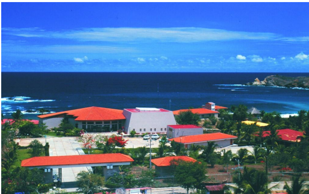
Centro Mexicano de la Tortuga.