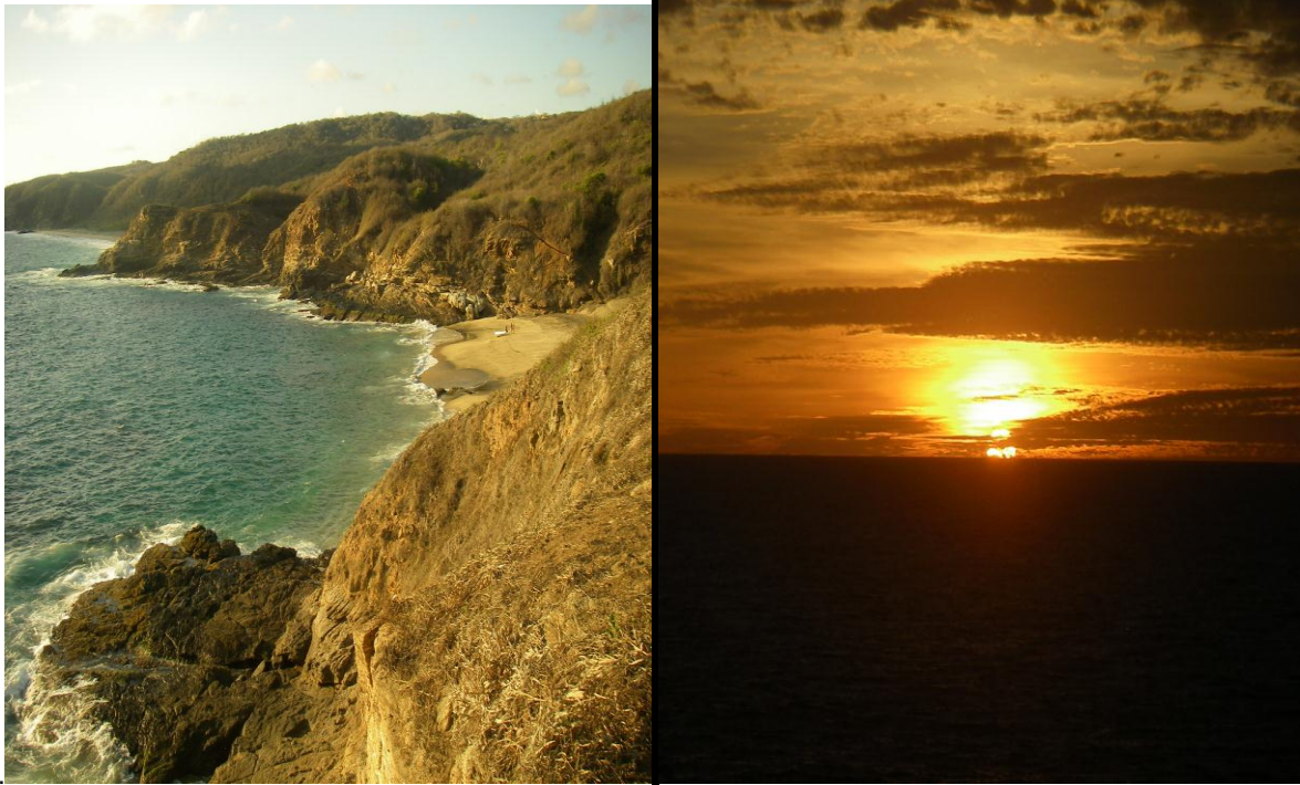
Playa de Punta Cometa y un hermoso atardecer visto desde la Punta.

Otro de los fuertes problemas ambientales a los que se enfrenta actualmente Mazunte es el del manejo de las aguas residuales. Desde la campaña del actual presidente de la República Felipe Calderón, se proponía apoyar el desarrollo sustentable en el país, incluso, dentro de sus 100 acciones prioritarias de Gobierno, prometía lo siguiente: