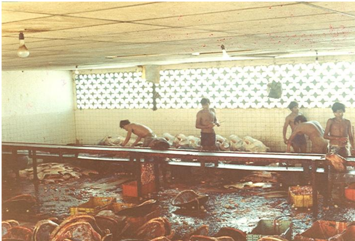
Rastro Tortuguero 1975.