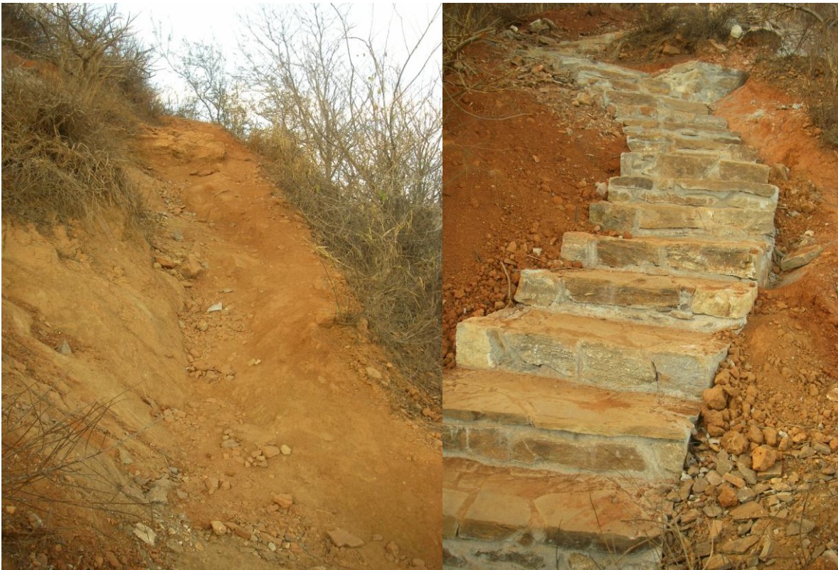
Fotografías comparativas de las bajadas más peligrosas de Punta Cometa.