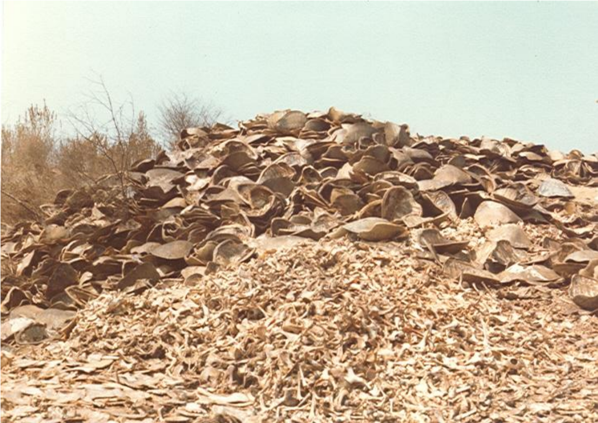
Rastro Tortuguero 1975.

En tanto avanzaba la explotación de la tortuga, se creó un Centro Biológico de Investigaciones de la Tortuga Marina “Daniel León Guevara”, cuya finalidad era investigar a fondo los ejemplares de la tortuga marina que eran explotados, así como educar a las cooperativas con respecto a la preservación de la especie. 42