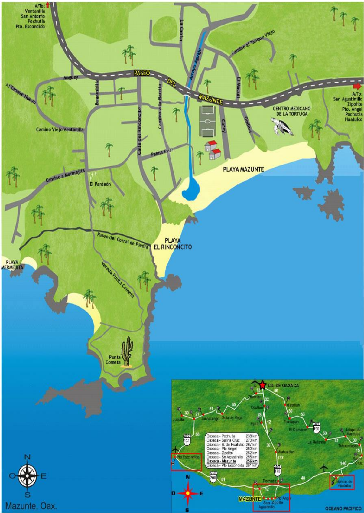
Mapa de la comunidad de Mazunte.