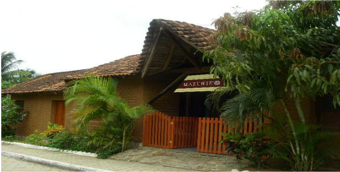
Fábrica de Cosméticos Naturales Mazunte A.C., Junio de 2009.

Otra de las más importante intervenciones que ocurrieron en la comunidad, pero esta vez por parte del Gobierno Estatal, el Gobierno Federal y por instituciones de crédito y fondos económicos, ocurrió justo después de los huracanes Paulina y Rick, que en 1997 arrasaron con las costas oaxaqueñas y parte de Guerrero, Acapulco: